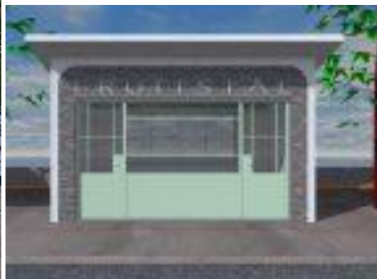
En zo moet het worden....