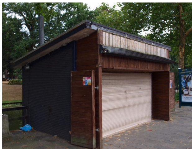
Zo ziet de kiosk er nu uit

Ooit het VVV-kantoor van Tiel naast de bushaltes. Het gebouwtje uit 1952 is, gelukkig, recent gered van de sloop door Stadsherstel Tiel en moet weer in oude luister hersteld worden. Er is een exploitant gevonden die er een horecazaak wil beginnen en die ook aan stads promotie wil doen vanuit de kiosk. De renovatie moet nog beginnen maar de nieuwe exploitant wil toch graag meedoen aan dit leuke evenement met zijn monumentje en geheel volgens de traditie gaat hij de kleine kiosk deze dag gebruiken om alle informatie over de open monumentendag in Tiel te verstrekken. Een echte aanrader, het startpunt van uw route.