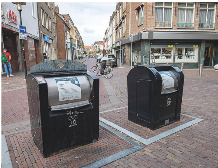
Binnenkort ontvangt u een brief over de geplande plek van de ondergrondse container in uw buurt. Heeft u daar vragen over of wilt u reageren? Kom naar één van de inloopbijeenkomsten of reageer via www.afvalscheidenheelgewoon.nl .